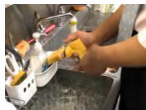
食器洗い・つけ置きにも!!